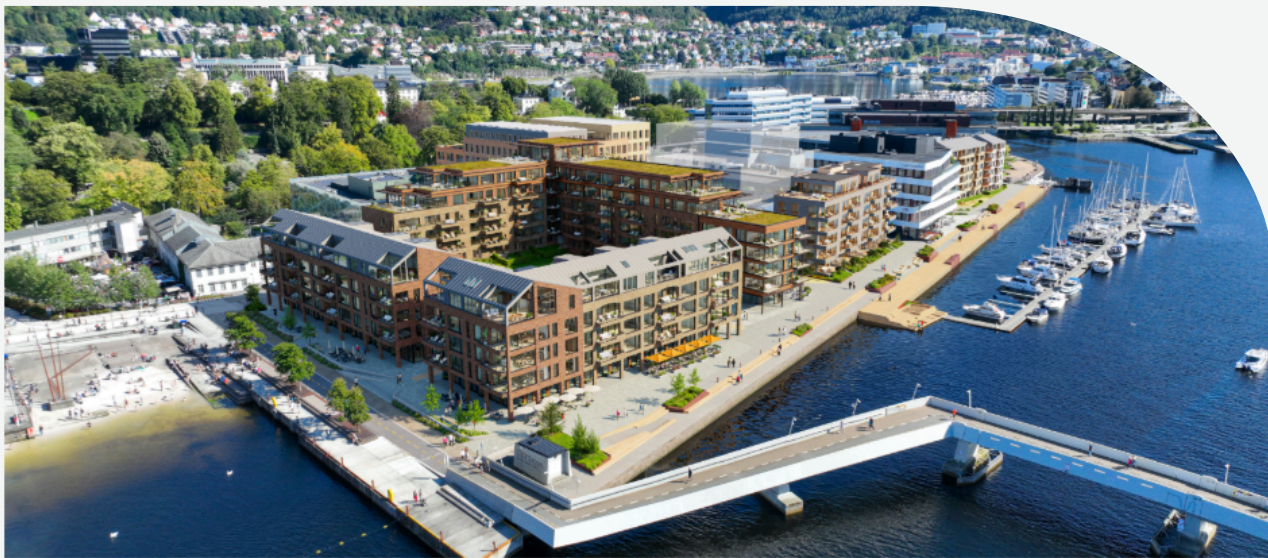
Illustrasjon: MER arkitektur

Status: Første byggetrinn – bygget nærmest Puddefjorden med 32 leiligheter – forventes oppstart på byggeplass rundt årsskiftet 2026/2027.